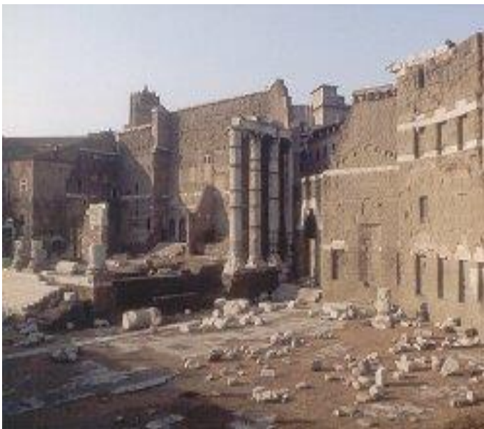
Het forum van keizer Augustus

Keizer Augustus ging er prat op Rome ‘ als een stad van baksteen te hebben aangetroffen en als stad van marmer te hebben achtergelaten ’. Samen met zijn trouwe secondant en boezemvriend Marcus Agrippa wist hij de hoofdstad van het imperium Romanum inderdaad te transformeren tot een monumentale metropool, die moeiteloos kon wedijveren met oostelijke pronksteden als Alexandrië, Antiochië en Ephesus.